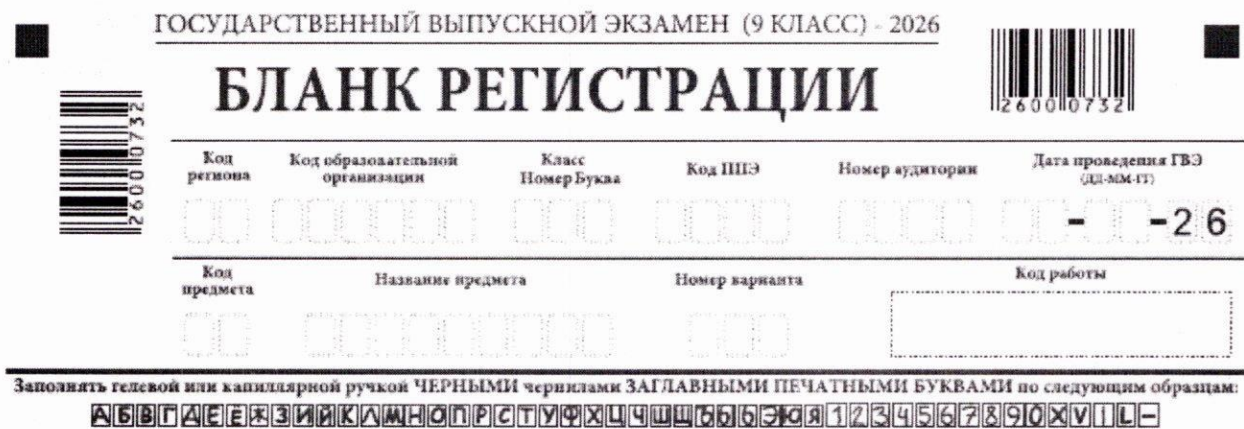
Рис. 1. Верхняя часть бланка регистрации

В верхней части бланка регистрации (рис. 1) расположены: вертикальный и горизонтальный штрих-коды, поля для рукописного занесения информации, строка с образцами написания символов.